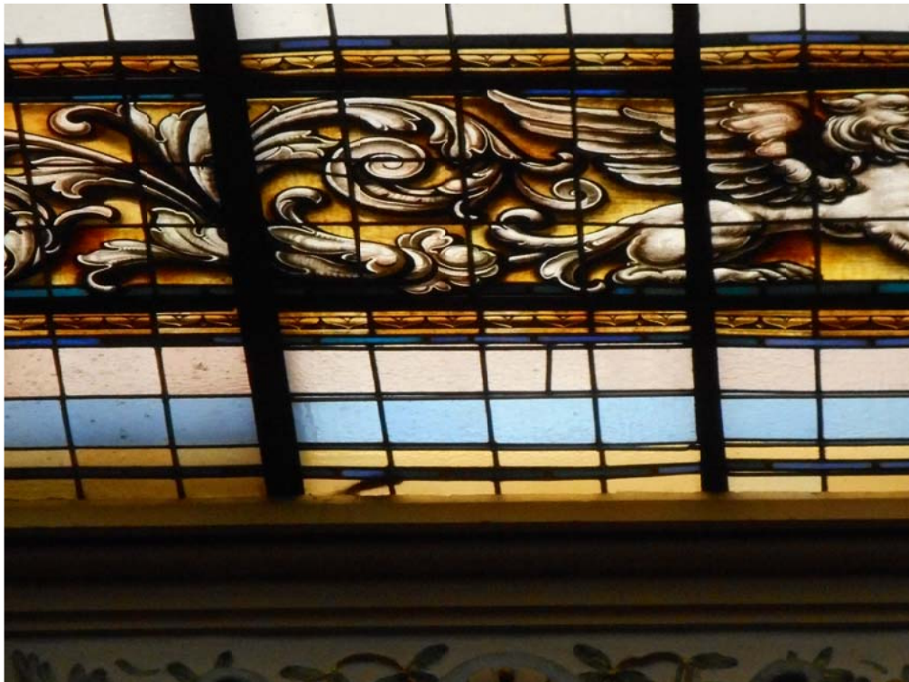
CUADRANTE 2, PIEZA 1H. Deformaciones, teselas partidas, y reparación con silicona