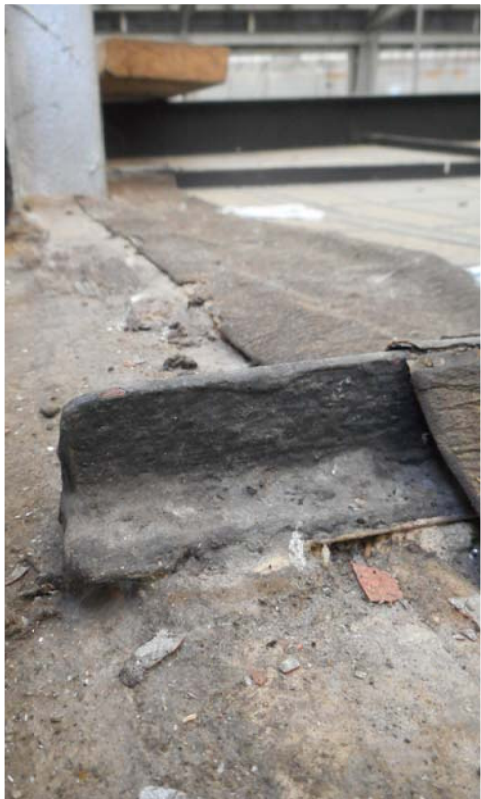
NERVIOS DE ACERO EN T. Deformaciones y pequeñas oxidaciones.