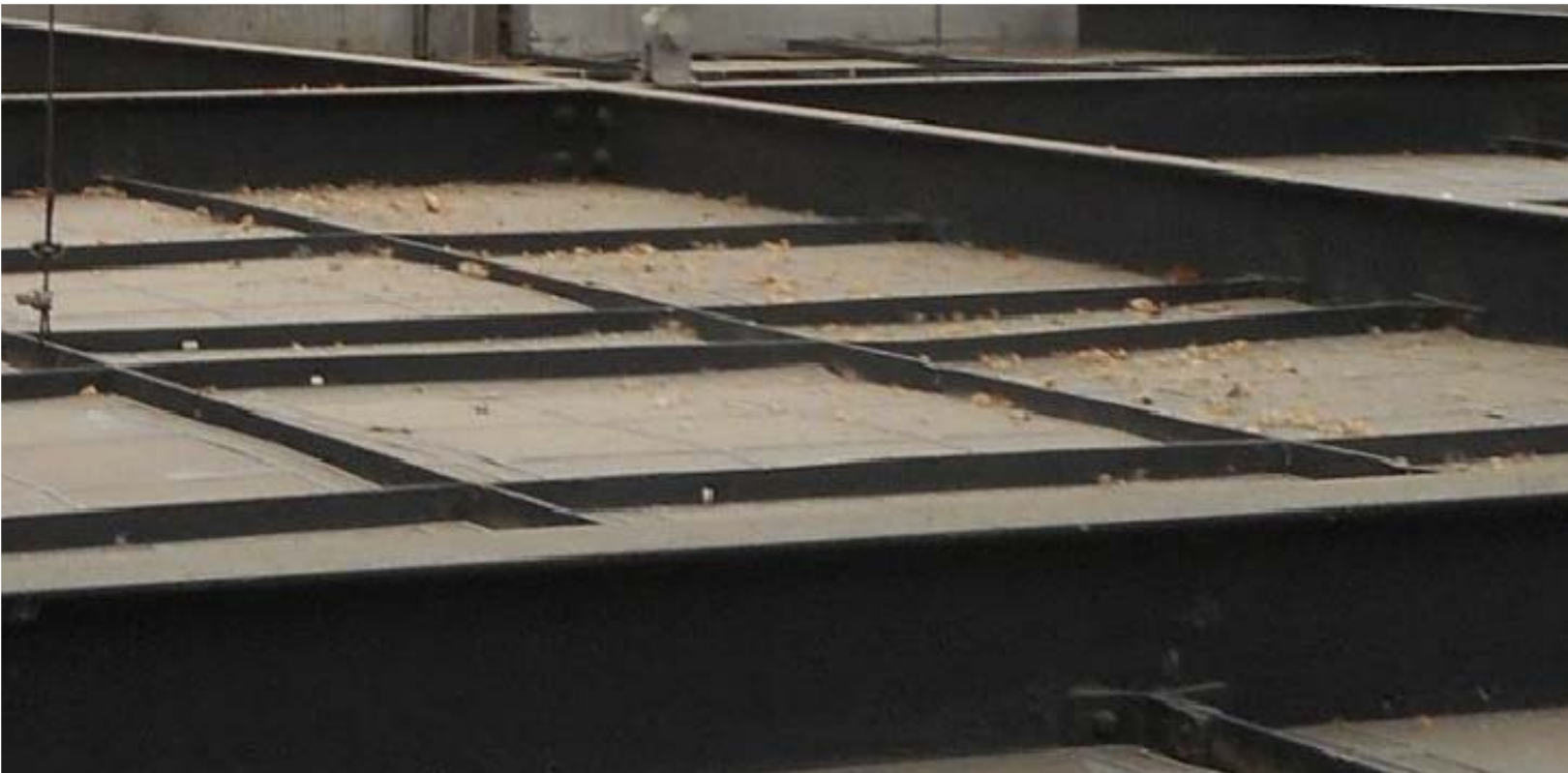
CUADRANTE 2. Deformaciones en placas, y acumulación de hojas secas y suciedad.